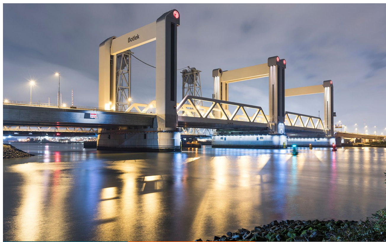
Automatisering van de bruginstallaties Botlekbrug

Projecten in de infrastructuur zijn per definitie interdisciplinair. Van ons als automatisering specialisten vereist dat veel kennis en begrip van regelgeving, stakeholders, verkeersstromen, veiligheid en milieueisen. En natuurlijk van elektromechanische, werktuigbouwkundige en hydraulische installaties. Wie bij ICT werkt, heeft een passie voor industriële automatisering, maar is ook gewend om v erder te kijken dan dat eigen vakgebied. Die open blik leidt telkens weer tot betere, vaak grensverleggende oplossingen voor meer veiligheid, betrouwbaarheid en kostenefficiency.