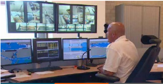
Systeemintegratie taakmanager en presentatiemanager MOBZ